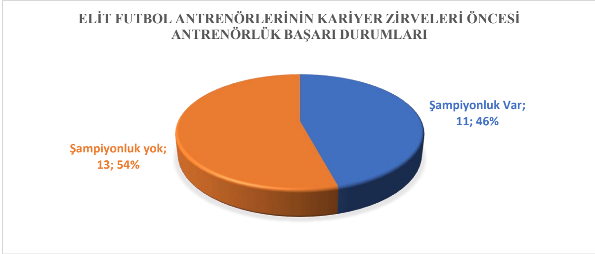
Şekil 4. Elit futbol antrenörlerinin kariyer zirveleri öncesi antrenörlük başarı durumları

Şekil 4’de, kariyer zirveleri öncesi antrenörlük kariyerleri süresince 24 elit futbol antrenörünün 11’inin %46 oranla antrenör olarak şampiyonluk deneyimi yaşadığı görülmektedir. Antrenörlerin %54’ü ise Tablo 2’de gösterilen mevcut başarıları öncesinde antrenör olarak şampiyonluk deneyimine sahip olmadıkları Şekil 4’e yansımaktadır. Oyuncuların beklentilerini en çok etkileyen faktörlerden biri antrenörün başarısıdır ve başarılı olan antrenörlere daha fazla yetkinlik kazandırır (Manley ve ark., 2010). Antrenörün daha önce kazandığı başarılar saygınlığını artırır.