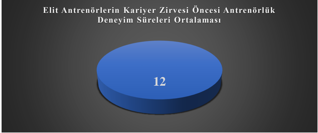
Şekil 2. Elit antrenörlerin deneyim süreleri ortalaması

Şekil 2’de 24 elit futbol antrenörünün, Tablo 2 üzerinde gösterilen kariyerlerinde zirve noktasındaki başarılarına ulaşmadan önce ortalama olarak 12 yıl/sezon antrenörlük mesleki deneyim süreci geçirdikleri görülmektedir. Ortalama 10 yıl ve üzeri bir futbol kulübünü yönetmek ve yüzlerce futbolcu ile antrenman, hazırlık, teknik ve taktik yönden birçok öğrenme durumunu yanında getirebilir. Bu noktada karar verme, futbol takımını kurma, antrene etme ve yönetme anlamında teknik direktörler için önemli bir deneyim ve öğrenme sürecinden bahsetmek mümkündür.