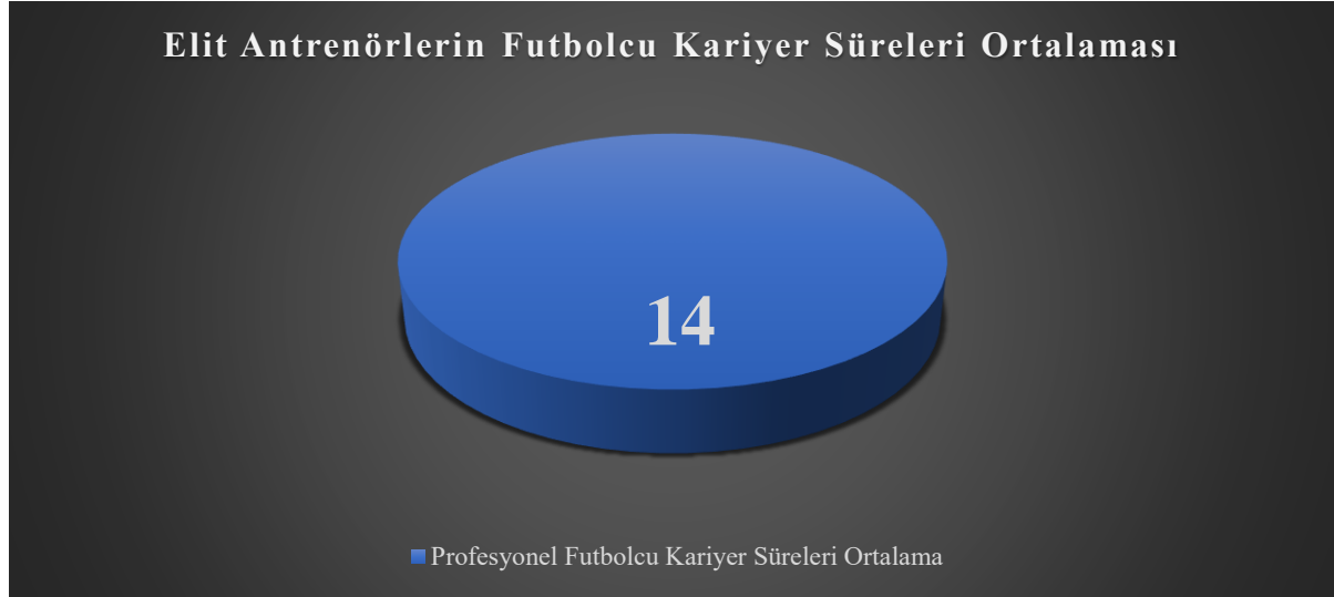
Şekil 1. Elit futbol antrenörlerinin profesyonel futbolcu kariyer süreleri ortalaması

Şekil 1’de, 24 elit futbol antrenörünün tablo 1 üzerinde gösterilen profesyonel futbolcu kariyer sürelerinin ortalama olarak 14 yıl/sezon olduğu görülmektedir. Antrenörlükte zirveye çıkmış olan grupta, futbolcu olarak uzun süren bir deneyim sürecinin mevcut olduğu anlaşılmaktadır. Bu uzun süreç içerisinde antrenör mesleğine giriş için önemli ve temel oluşturabilecek bilgi ve becerilerin kazanılmış olması, teknik direktörlük kariyeri açısından faydalı bir durumdur. Futbolcu kariyerinde farklı birçok teknik ekip ile çalışma fırsatı yakalayabilen sporcular için her antrenörden farklı teknik ve taktik yönden öğrenebileceği bilgiler ve uygulamalarla karşılaşması antrenörlük sürecinde kullanılacak kıymetli bir birikimdir. Bu noktada elit seviyede antrenörlerle çalışma fırsatı yakalayan futbolcuların şanslı olduğu söylenebilir. Sporcuların kendi oyunlarına ve kişisel özelliklerine yakın buldukları antrenörleri örnek almaları sporda sık karşılaşılan bir durum olmakla birlikte sporcunun öğrenme ve gelişimine katkı sağlaması olağandır. Pek çok sporcu idol olarak benimsediği antrenörü örnek alır ve kendi antrenör kariyerinde bu temeli yansıtabilir. Uzun futbolcu kariyerinde elde edilebilecek bu tür öğrenmeler sportif kariyerini başarılı birer antrenör olarak devam ettiren teknik direktörlerin en önemli kazanımlarındandır.